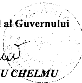
SORIN SERGIU CHELMU